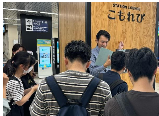
北総鉄道施設見学の様子